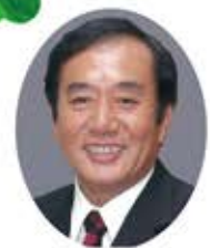
ゲスト 上田清司埼玉県知事 来場予定